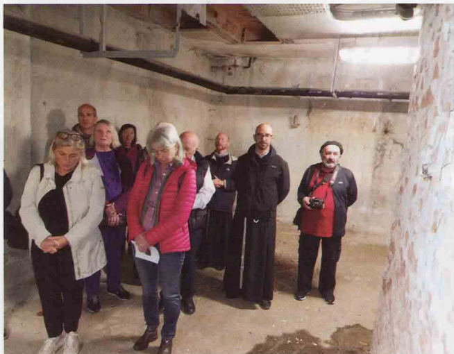
V bunkerju Gestapa