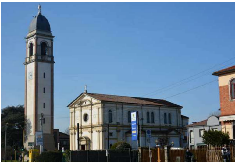
Cerkev v Chiesanuovi; spodaj: med obiskom so udeleženci zapeli slovenske pesmi.

nekdanjega taborišča nam je ostala nedostopna, saj nam dovoljenja za vstop niso dali. Ob prvem jesenskem poskusu je bil razlog (ali pretveza) pandemija, ob marčnem novem pozivu pa so se sklicevali na varnost, češ da je območje zaprto in zanemarjeno že več kot desetletje.