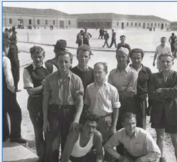
Slovenski interniranci na dvorišču taborišča

Lastnoročni osnutek pisma za p. Corteseja, ki ga je verjetno Ozna odnesla iz škofijske pisarne med eno izmed številnih povojnih preiskav, saj se je ohranil v nekdanjem arhivu Centralnega komiteja Zveze komunistov Slovenije