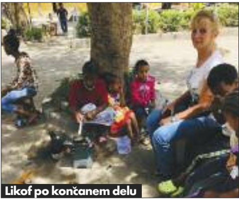
Likof po končanem delu